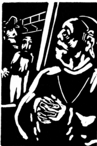
Aad de Haas, Voor de Hogepriester 11 (1961), linoleumsnede op Ino-Shi papier, 25,4 x 19 cm, Collectie SCHUNCK*, fotografie Foto Studio 10 bv, Heerlen

SCHUNCK* toont werken van Aad de Haas waarin te zien is hoe hij zijn maatschappelijke betrokkenheid, in combinatie met persoonlijke ervaringen, tot uiting brengt in zijn werk. Zijn ervaringen in de Tweede Wereldoorlog en later de aanvaring met de katholieke kerk voedden zijn 'Geest van Verzet'.