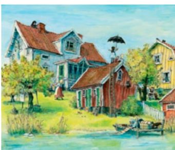
De tentoonstelling vindt plaats in het kader van de Kinderboekenweek 2014 en wordt mede mogelijk gemaakt door het Nederlands Letterenfonds.